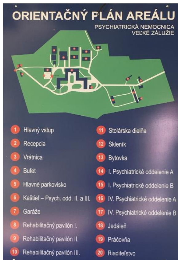
Obr. č. 1 Orientačný plán

Areál zariadenia sa nachádza v prostredí rozsiahleho parku pôvodného kaštieľa Esterházyovcov. V areáli zariadenia sa nachádza niekoľko samostatných budov, či už pre liečbu pacientov, alebo materiálno-technického zabezpečenia.