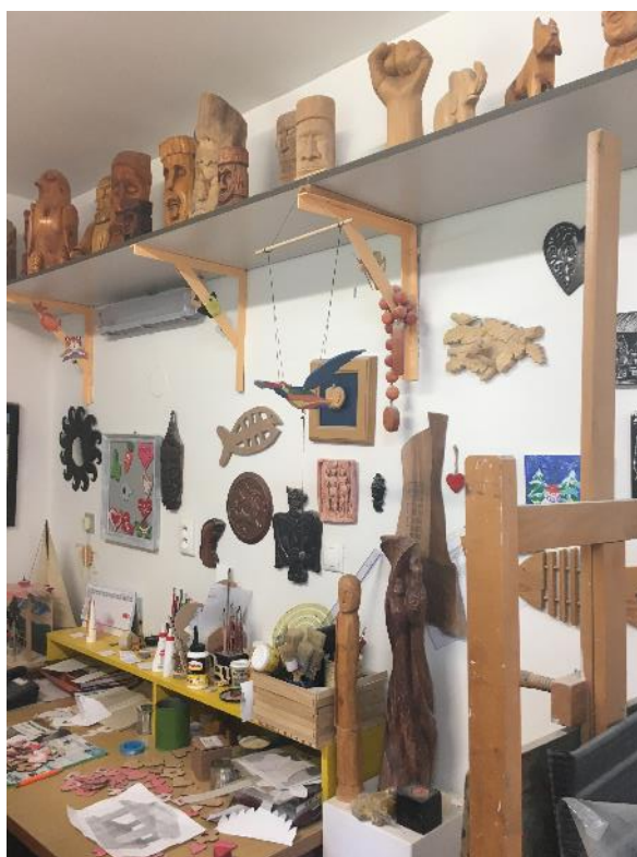
Obr. č. 11, 12 Dielne