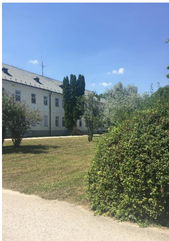
Obr. č. 2 Vnútorný areál zariadenia

Budova je vykurovaná plynovými kotolňami. Prostredie z hľadiska vykurovania je závislé na kvalite obvodového plášťa budovy (nedostatkú sú nezateplené budovy a nevyhovujúce okná).