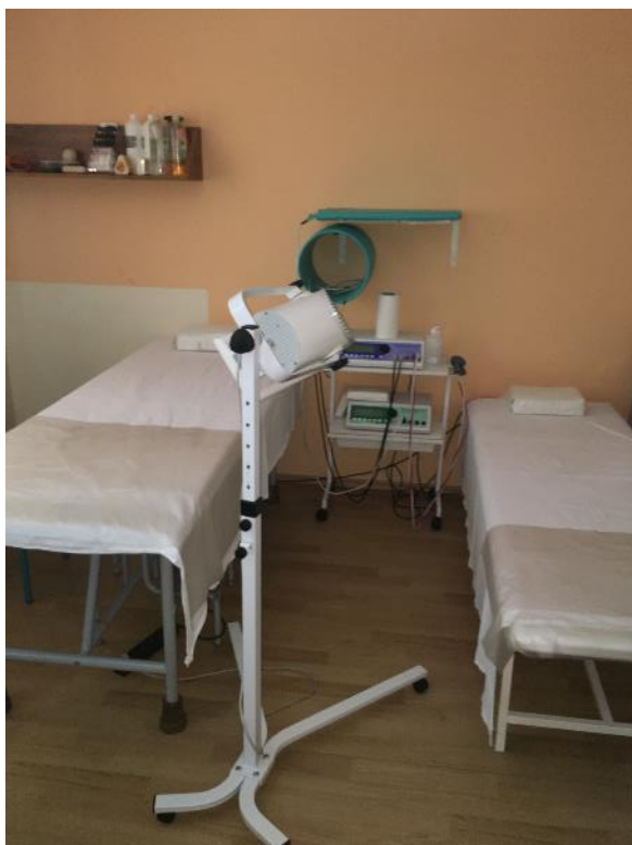
Obr. č. 7 Liečebná miestnosť