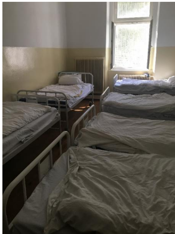
Obr. č. 3, 4 Izby pacientov

Izby neposkytovali pacientom dostatok súkromia, nakoľko posteľe sú na izbe natlačené jedna vedľa druhej. Pre zvýšenie štandardu ubytovacích podmienok v zariadení je nevyhnutné, aby pacienti mali dostatok súkromia. Zariadenie by malo prijať potrebné kroky na zlepšenie materiálnych podmienok a znížiť obsadenosť izieb tak, aby pacienti mali dostatok priestoru zaisťujúci im súkromie.