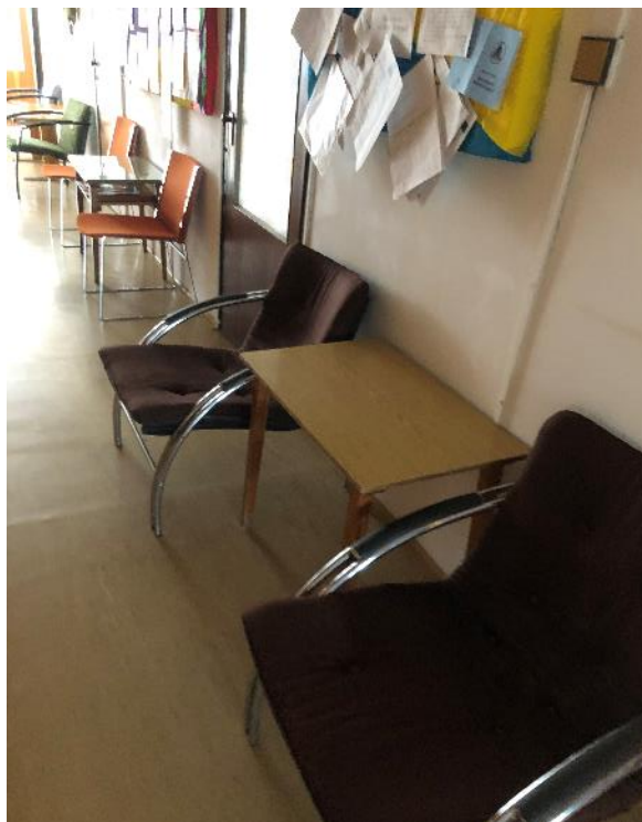
Obr. č. 6 Chodba