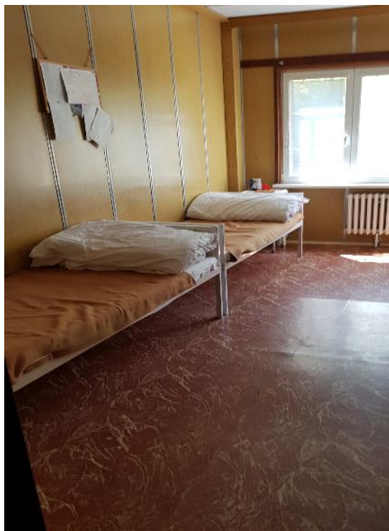
Obr. č. 5 Izba pacientov