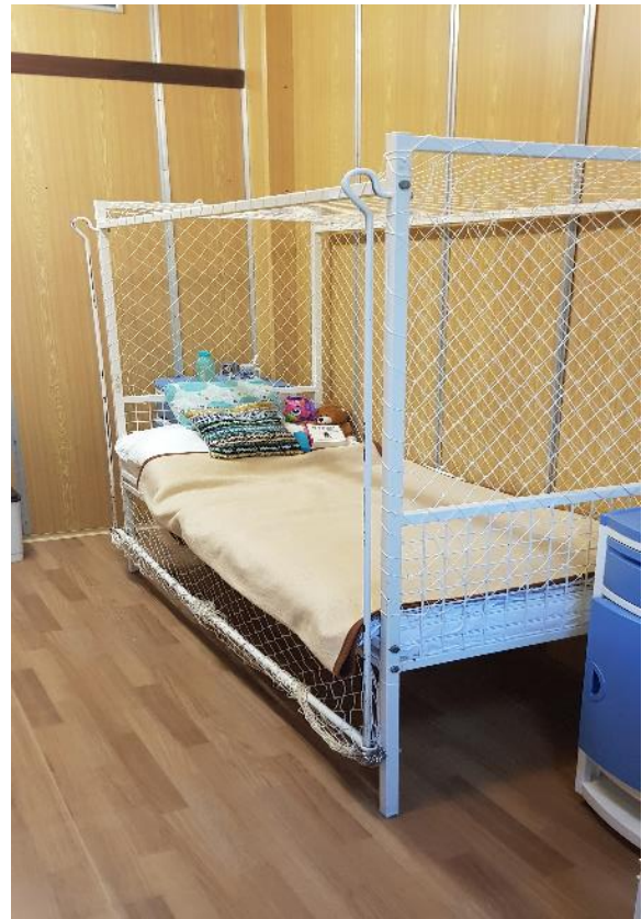
Obr. č. 9, 10 Sieťové posteľe

Zariadeniu chýba vyhodnotenie používania obmedzovacích prostriedkov. Chýbajú verbálne intervencie pred použitím obmedzovacích prostriedkov. Hodnotenie deeskalačných techník nie je realizované a konzultované s pacientmi tak, aby boli identifikované spúšťače a faktory, ktoré môže vnímať pacient ako nápomocné v predchádzaní kríz a aby boli definované